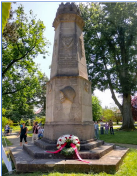
Das Bundes-Radfahrer-Denkmal am 17. Juni 2023.

Es wurde vom Bund Deutscher Radfahrer durch Spendensammlungen finanziert.