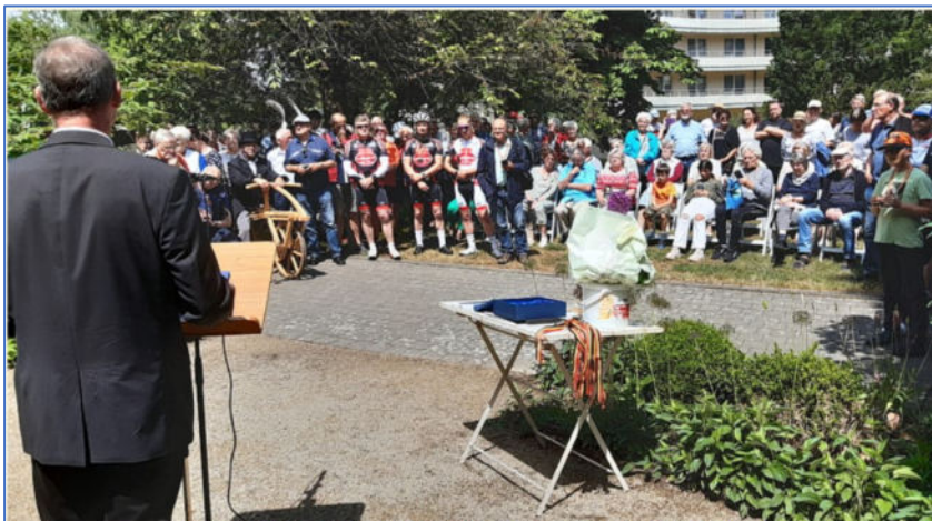
Am 17. Juni 2023 wurde das 100-jährige Bestehen des Bundes-Radfahrer-Denkmal mit einem Festprogramm gebührend gefeiert.